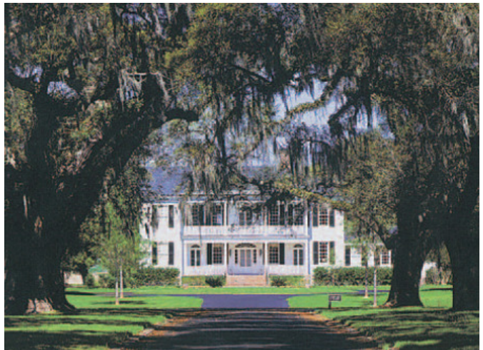
Vicksburg mit der Gedenkstätte an den Bürgerkrieg.

Entfernung etwa 400 km. Am Morgen Fahrt durch das südliche Louisiana über Baton Rouge in den Bundesstaat Mississippi, etwa gleich groß wie Louisiana. Durch den „Alten Süden“ mit den typischen „Antebellum Villen“ und den moosbewachsenen Magnolienbäumen nach Natchez am Mississippi (etwa 350 km). Die Stadt ist eine der besterhaltenen Städte des „Alten Süden“ mit über 500 erhaltenen historischen Bauten. Weiterfahrt nach